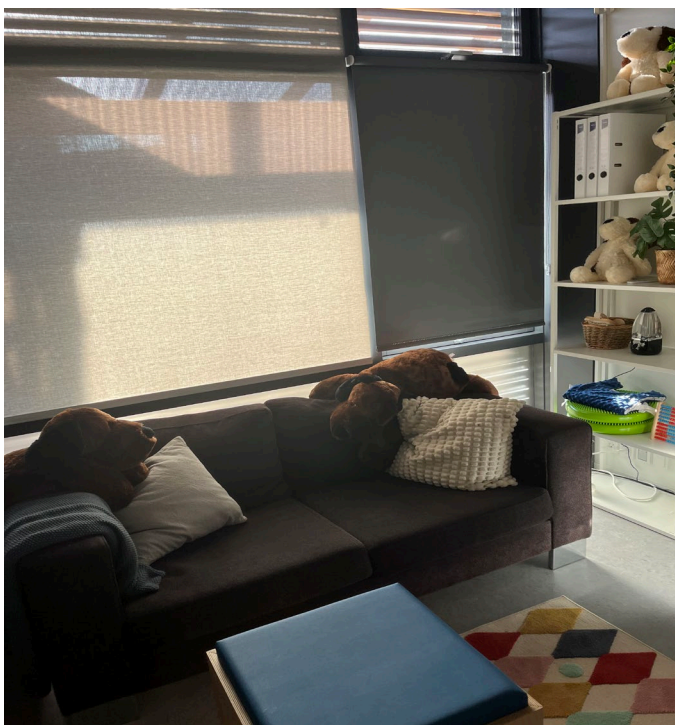
Rum indrettet til arbejdet med 1-1.

I afdelingen i nr 44 vil de arbejde med det grimme sprog fremadrettet og i afdelingen i nr 50 A har de valgt at arbejde med medindflydelse. Der er udarbejdet en smtte model for hvert hus.