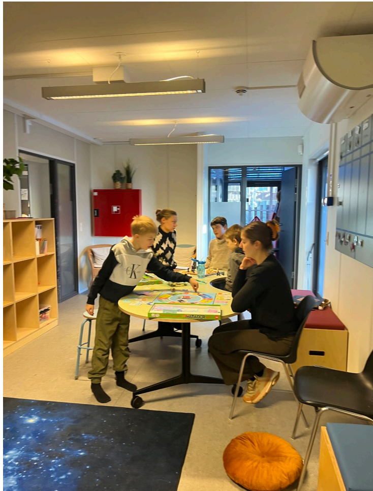
Spil cafe i KKFO'en

Der samarbejdes på tværs af matriklerne og vi opfatter de to matrikler som ét hus med én personalegruppe.