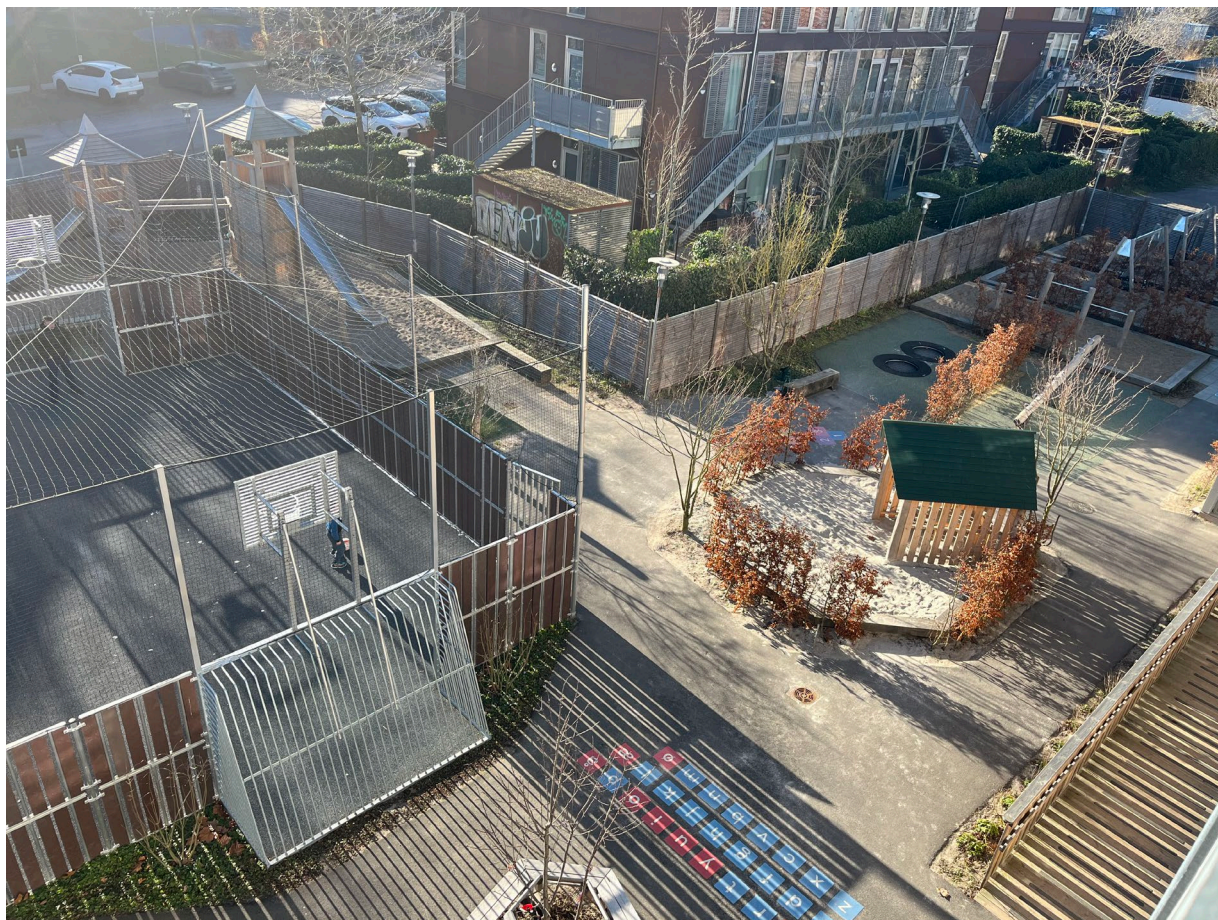
Gården til bygningen i 50 A